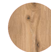
Eiche wild weiß

man miteinander und entdeckte viele Gemeinsamkeiten. Da ist der Hang zum Perfektionismus. Die Liebe zum Design, das die Sinne berührt. Der kompromisslose Innovationsgeist. Weil die Grenze zwischen Badezimmer und Wohnraum ohnehin immer mehr verschwimmt, entschloss man sich, die Kompetenzen beider Unternehmen für ein ganz besonderes Projekt zusammenzuführen. Das Ergebnis ist die EDITION LIGNATUR.