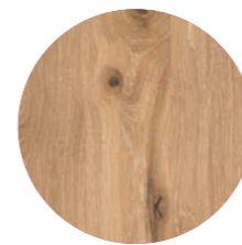
Eiche wild weiß